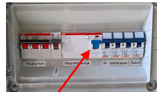
Kuva 1 Vanhan ampumakopin valokatkaisija kytkee sähköt myös vanhaan valvojakoppiin.